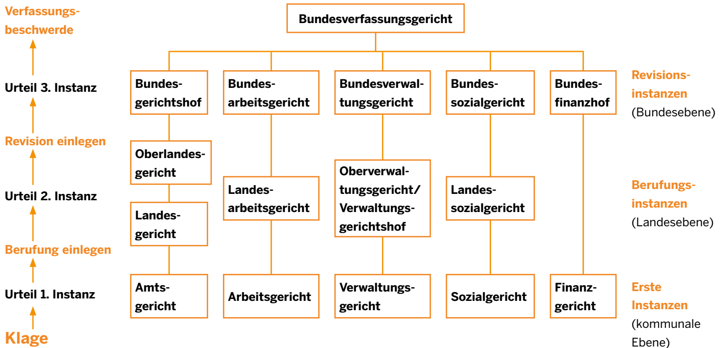
Schaubild: Überblick über den Rechtsweg in Deutschland

Über den Rechtsweg hinaus gibt es verschiedene Kinderinteressenvertretungen und Beschwerdeinstanzen, die teilweise auch individuelle Beschwerden von Kindern entgegennehmen bzw. bei der Einlegung einer Beschwerde oder im Klageverfahren beraten und unterstützen. Diese Einrichtungen gibt es in Deutschland auf allen Ebenen, d.h. auf Ebene der Kommunen, der Länder sowie des Bundes. Bei einer Kinderrechtsverletzung hat man zwei Möglichkeiten. Entweder spricht man Institutionen mit einem allgemeinen Mandat an, wie den Petitionsausschuss des Bundestages